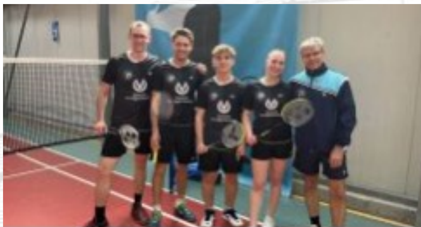
Badminton: Sieg im Bezirkspokal 8. Mai 2023